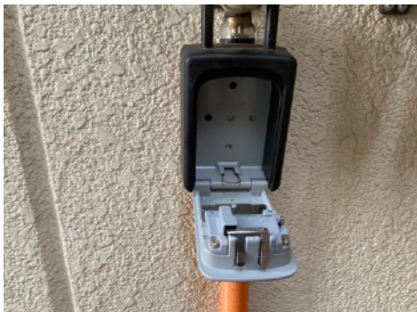
④蓋は開けっぱなしにしておき退店時に鍵を戻し、閉めていただくようお願い致します。