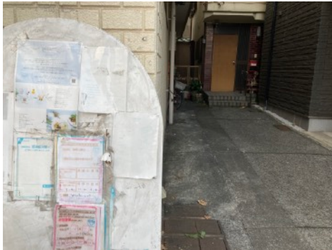
①店を正面に右手の路地を真っ直ぐ進みます