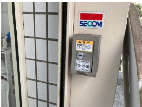
⑤店頭に戻り、短い鍵で右手にあるシャッターボックスを開き上ボタンを長押しします。