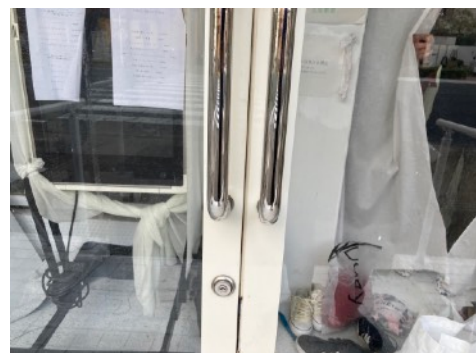
⑥長い鍵で店頭のドアを開けます。引き戸です。