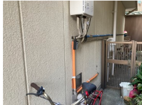
②突き当たりに黒いキーボックスがございます