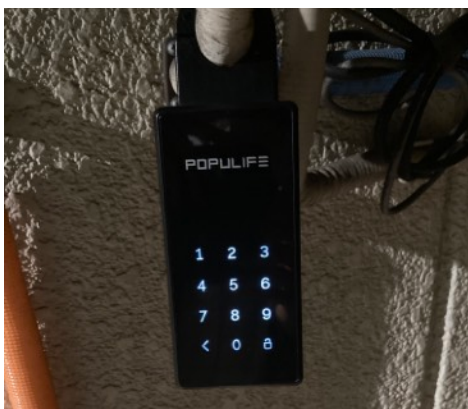
③登録いただいたメールアドレス宛に事前にお送りしております、ワンタイムパスワードを入力後、右下の解除ボタンを押してください。解除されましたら蓋を開けて鍵を取り出します。